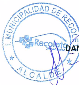
DANIEL JADUE JADUE ALCALDE